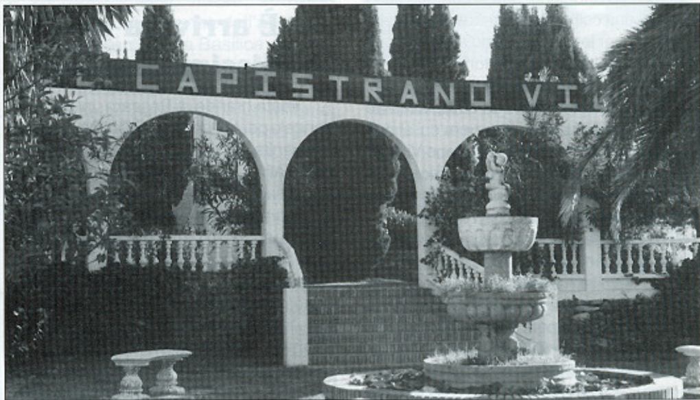
Ingresso al Capistrano Village

Io ne ho trovato un altro in Spagna, sulla